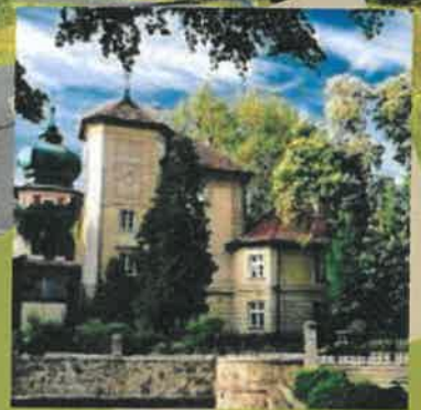
DZIEŃ 3 Łańcut