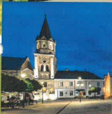
DZIEŃ 1 Sanok